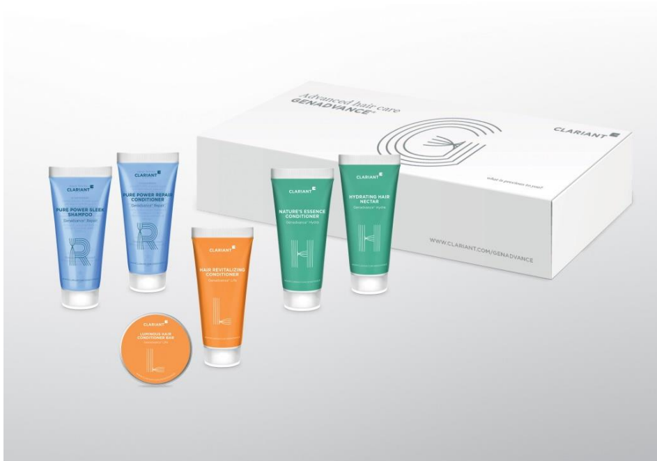
Clariant surpreende o mercado com os novos ingredientes de condicionamento capilar Genadvance.